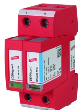
Fotografía no vinculante