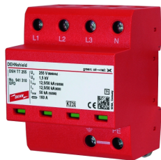
Fotografía no vinculante