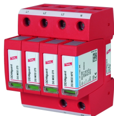
Fotografía no vinculante